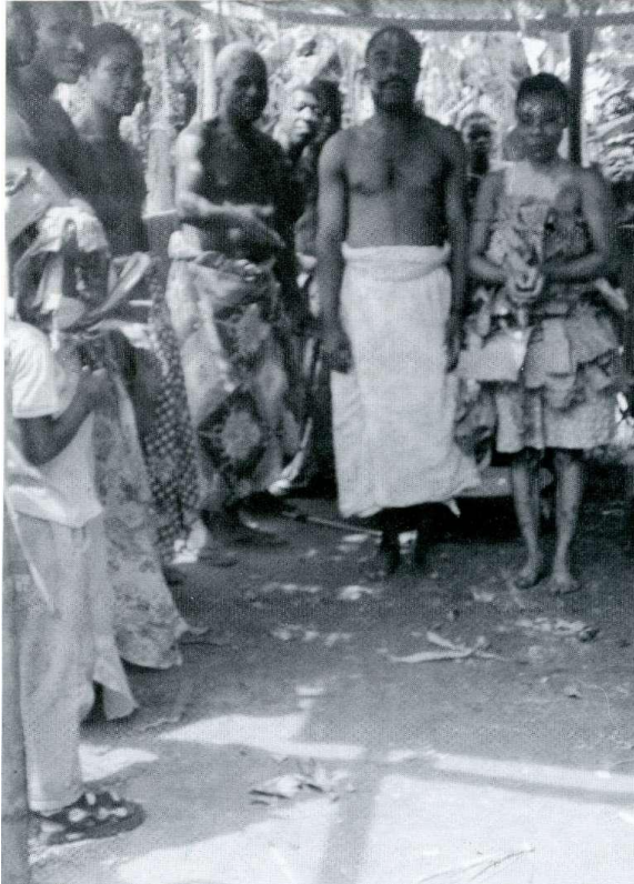
Baa-bissio o matrimonio bissio.

En todos los casos, una vez presentadas las pretensiones, la clásica petición de mano, con ciertos ofrecimientos de rigor, se llegaba a la concertación del casamiento con la fijación de las fechas. Después de un acto solemne, se procedía a la fundación de los dótiles bifuba-para cunde o dote, consistentes en ciertos objetos metálicos reconocidos, utensilios de madera, animales.