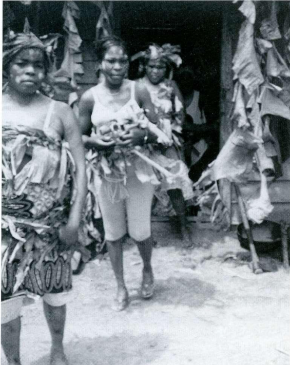
Acto de presentación de las jóvenes ya con capacidad de casarse.

En fin, terminados los actos del casamiento con la entrega de la mujer y establecida en la residencia de su actual esposo como miembro del grupo, ya con el matrimonio, comenzaba la familia.